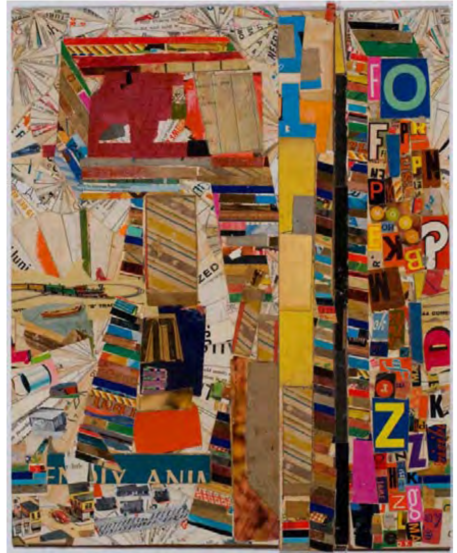
Watch Tower, collage, 2009, 46 X 37 cm

« J'aimerais faire des choses qui seraient mystérieusement puissantes. J'aimerais établir une communication non consciente que les gens sentiraient sans pouvoir pointer du doigt. Les gens de tous les jours – c'est les gens que je veux toucher ».