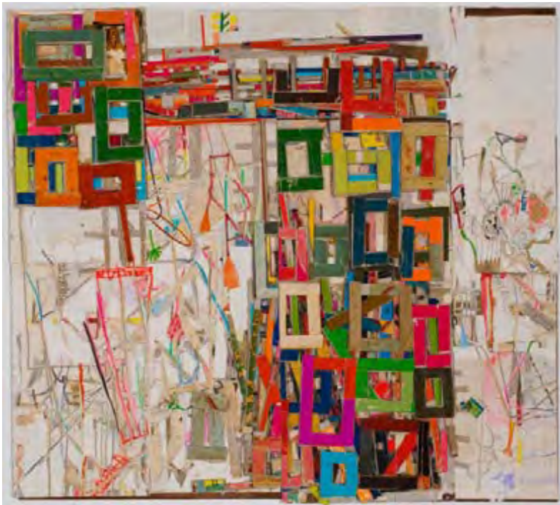
Big Hammer , collage, 2010, 52 X 58,4 cm