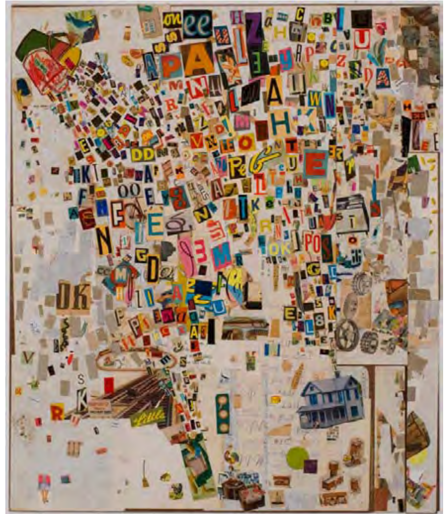
Embarassing Confession , collage, 2010, 71,7 X 60,7 cm