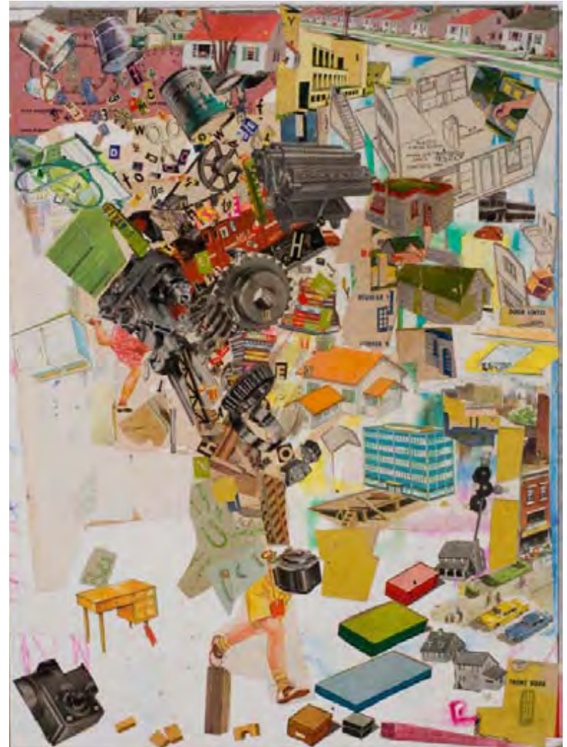
I want to be an architect , collage, 2010, 40,6 X 30,5 cm