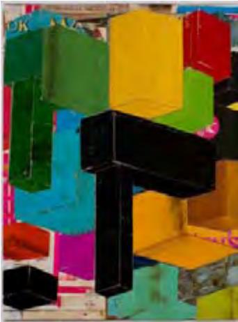
Combine, collage, 2010, 41,9 X 31,7 cm