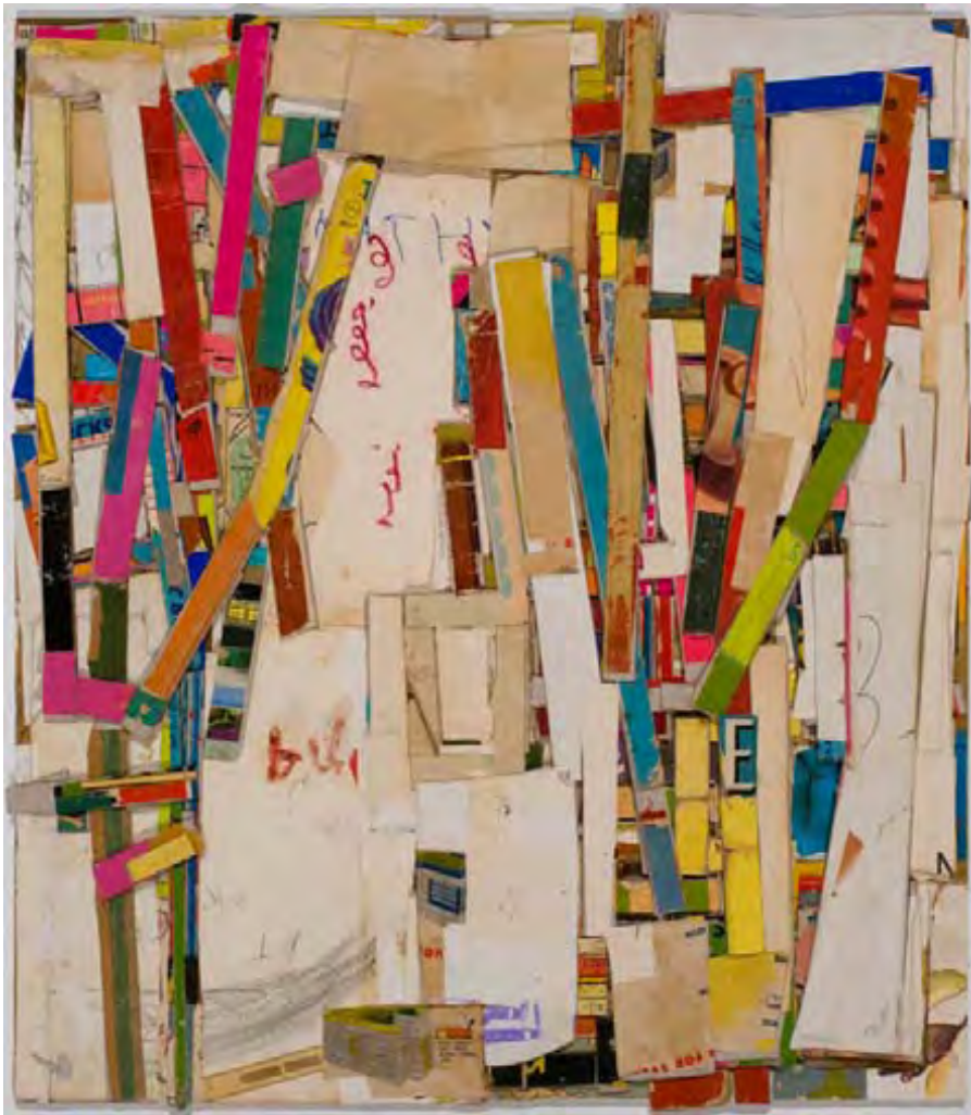
Walking to work , collage, 2010, 45,7 X 40 cm