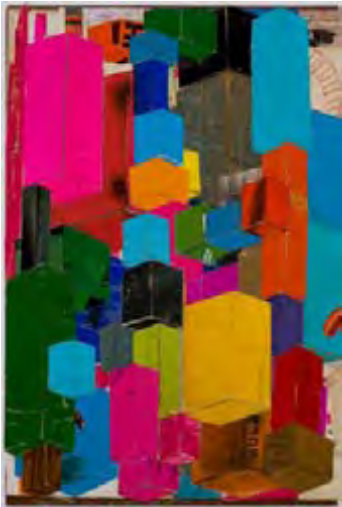
Idea for a tower #2, collage, 2010, 41,9 X 27,8 cm

à l'harmonie syncopée et cristalline. Son travail est le produit d'une recherche intensive et continue des permutations possibles de l'association radicale entre ciseaux, papier et colle.