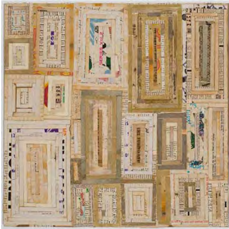
White Gown , collage, 2006, 40,6 X 40,6 cm