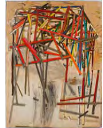
Mr. Potato Head , collage, 2009, 30,5 X 22,9 cm

«I would like to make things that are mysteriously powerful. I'd like to make a nonconscious communication that people feel and can't put their fingers on. Everyday people – those are the people I want to impress.»