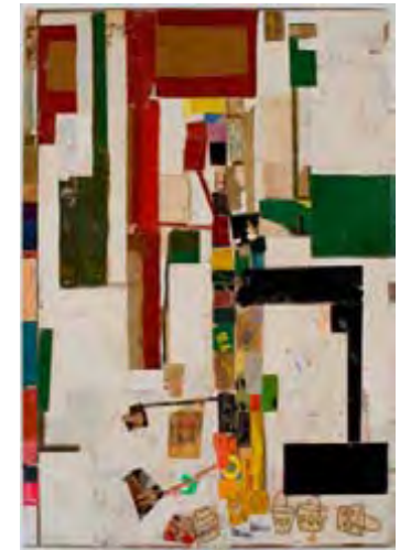
Bad Word , collage, 2009, 76 X 50,8 cm