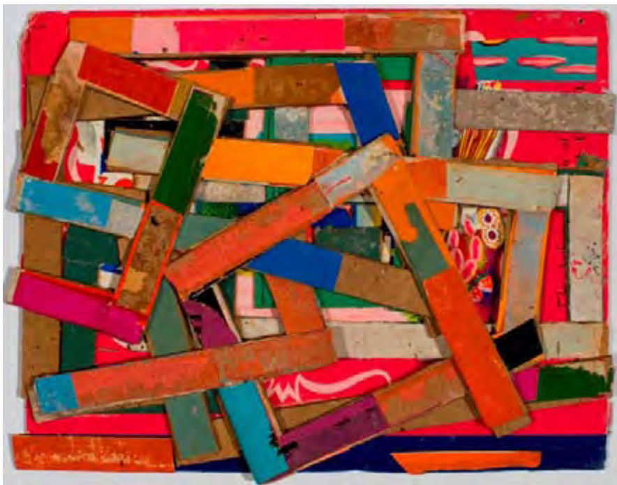
Little Difficulty , collage, 2009, 19 X 26,7 cm

zijn diepste herinneringen te koppelen. Meer nog dan het onmiddellijke plezier verschaft door stralende vormen, kleuren en texturen, schuilt hierin de waarde van het werk.