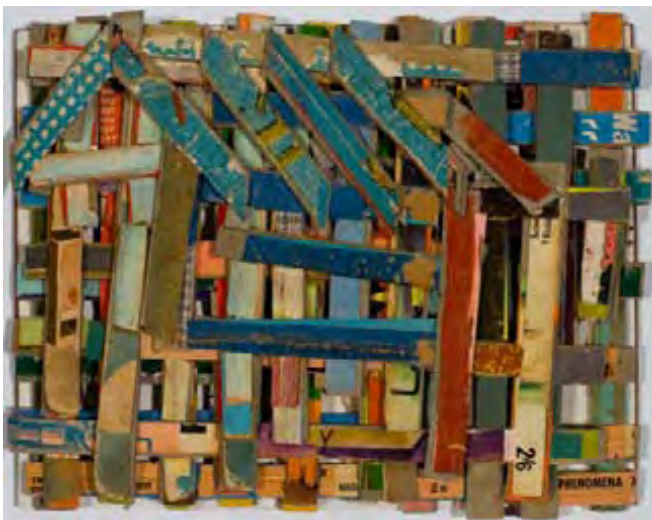
Little House, collage, 2009, 21,6 X 27,9 cm