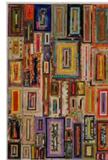
Little Girl , collage, 2006, 76,8 X 50,8 cm

« Ik zou graag dingen maken die op een vreemde manier krachtig zouden zijn. Ik zou een onbewuste communicatie willen opzetten die de mensen wel zouden ervaren, maar niet meteen duiden. De doorgewone mensen van alledag – die wil ik raken ».