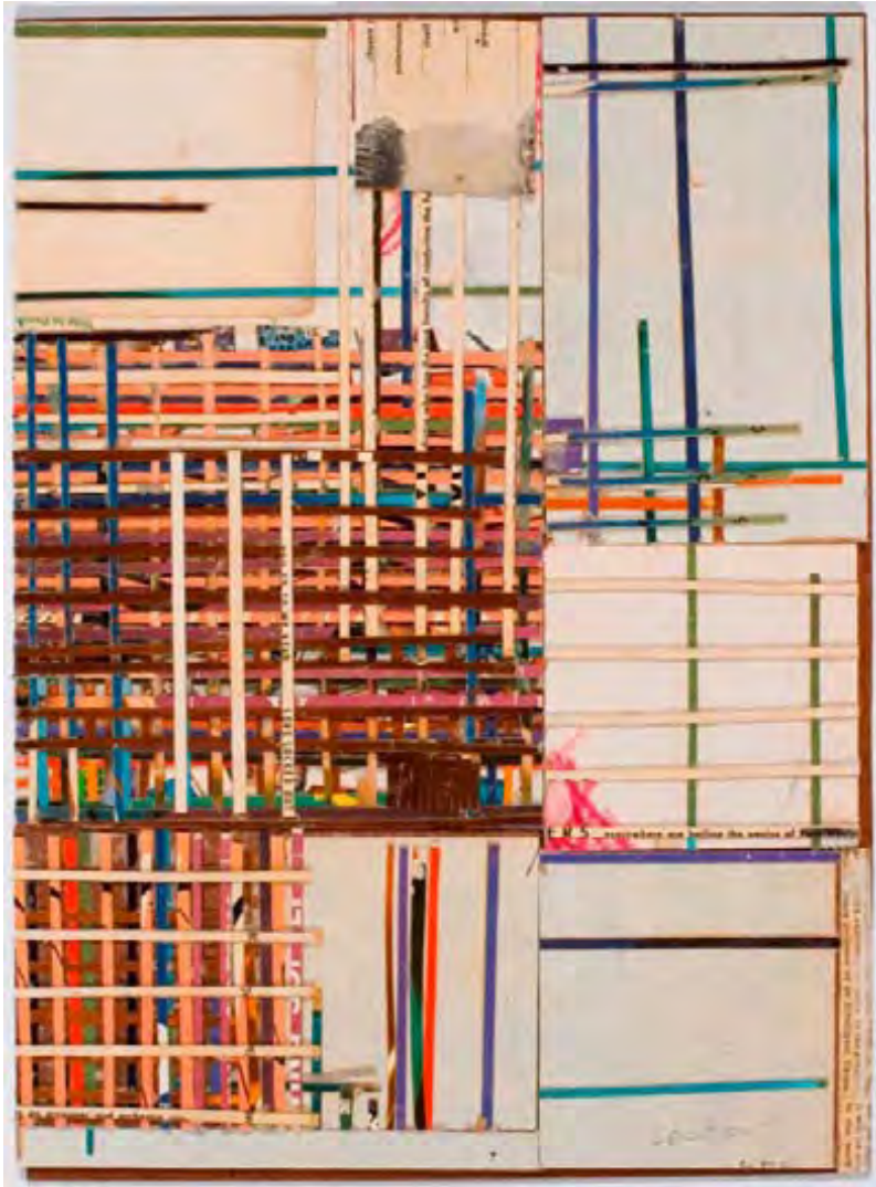
Lock Out , collage, 2007, 30,5 X 22,2 cm