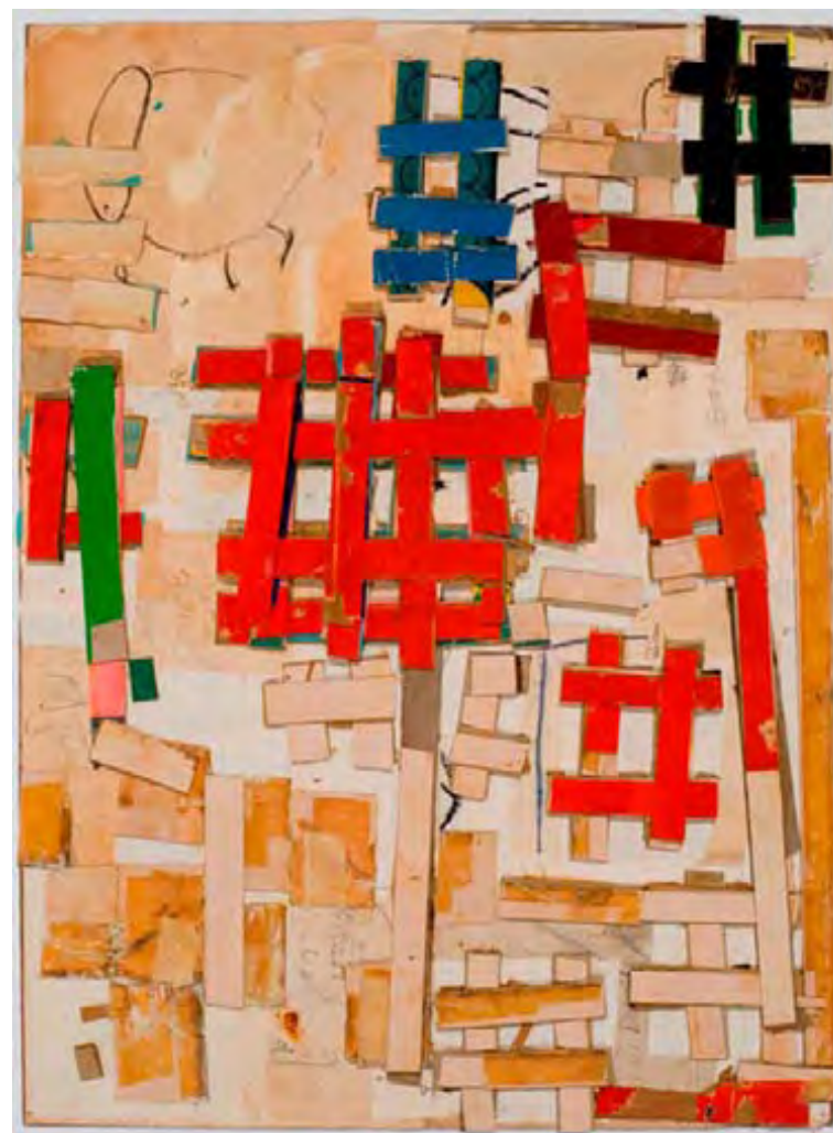
Vex, collage, 2009, 50,8 X 37,4 cm